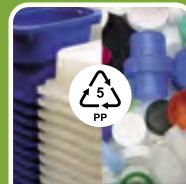
Plastik (Typ 05)