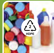
Plastik (Typ 02)