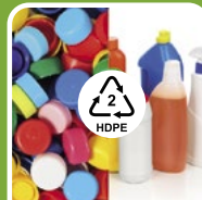
Plastik (Typ 02)