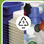
Plastik (Typ 05)